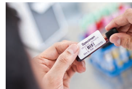
Остава само да залепите готовия етикет