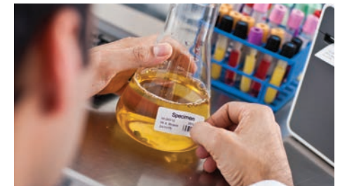
Гарантирайте си коректно и четливо обозначаване на всички проби и медикаменти