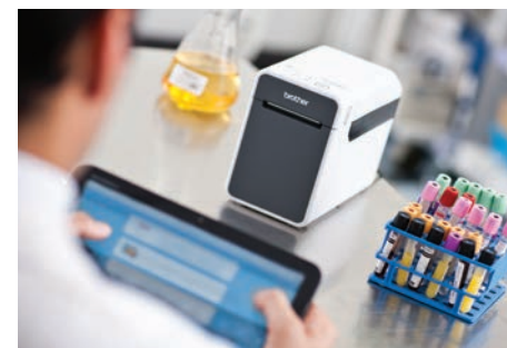
Бъдете свободни - печатайте безжично от буквално всеки таблет или мобилно устройство

Мобилният SDK (Mobile Software Development Kits) прави печатането на етикети през мобилни приложения изключително лесно за програмиране. Има налични SDK за iOS, Android и Windows Mobile