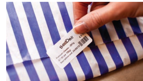
Лепилото в RD лентите е сертифицирано като напълно безопасно за употреба в хранителната индустрия