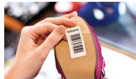
Избирайте сред голямо разнообразие етикети за TD-2000

RD лентите не съдържат Bisphenol-A, химикал използван широко в световното производство на етикети. Поради това Brother RD етикетите за напълно безопасни за употреба в хранителната индустрия и не вредят нито на Вашето здраве, нито на това на деца Ви.