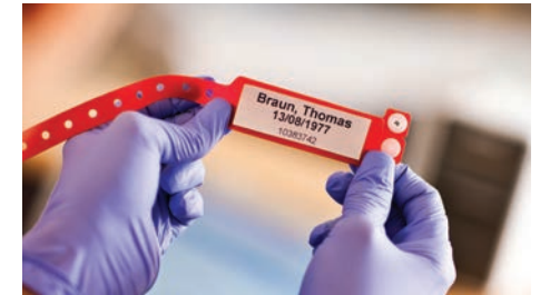
Отпечатайте данните на пациента още при регистрацията му