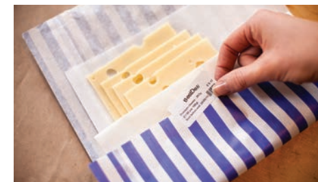
Осигурете спокойствие на Вашите клиенти с етикети "Годно до"