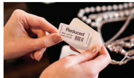
Обозначете залежалите стоки с табелки за намаления и разпродажби докато обикаляте из магазина