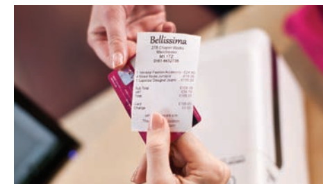
Давайте четливи и добре изглеждащи касови бележки на клиентите си