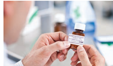
Размерите на етикетите могат да се нагодят в зависимост от мястото на поставяне